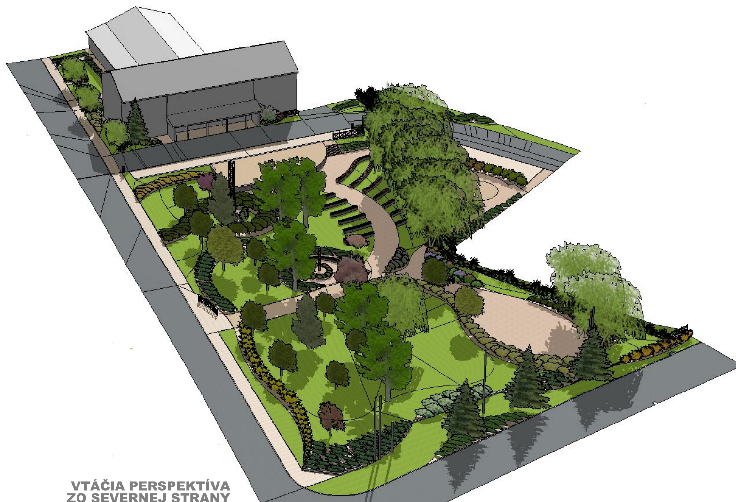
VTÁČIA PERSPEKTÍVA ZO SEVERNEJ STRANY