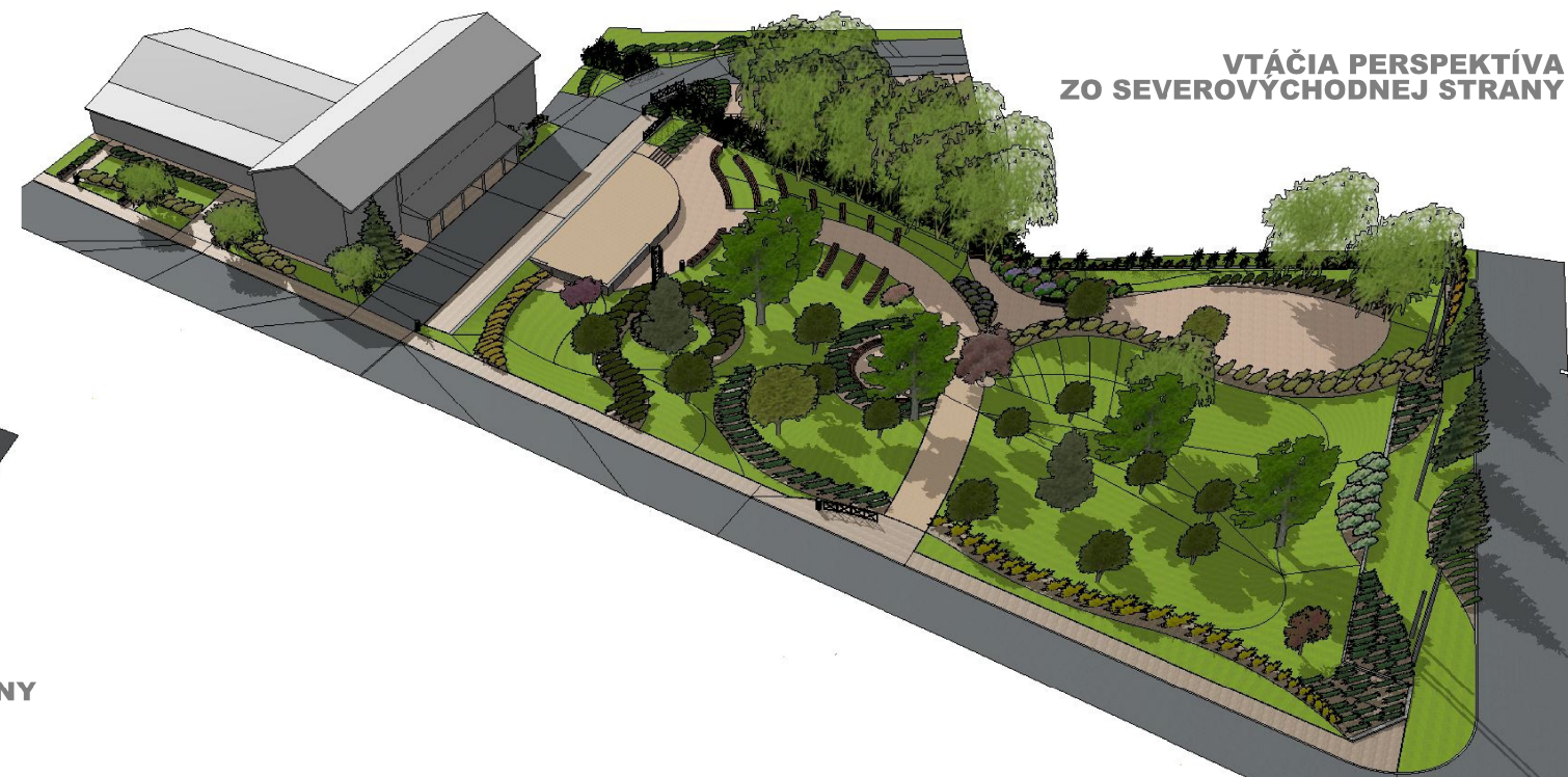
VTÁČIA PERSPEKTÍVA ZO SEVEROVÝCHODNEJ STRANY